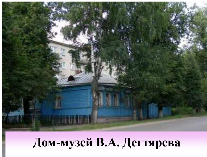
Дом-музей В.А. Дегтярева Улица Дегтярева, 6-а

Здесь с 1924 года жил с семьей Василий Алексеевич Дегтярев (02.01.1880 - 16.01.1949), выдающийся конструктор стрелкового автоматического оружия, генерал-майор инженерно-артиллерийской службы, доктор технических наук. Созданные им образцы автоматического оружия стояли на вооружении армии более 40 лет.