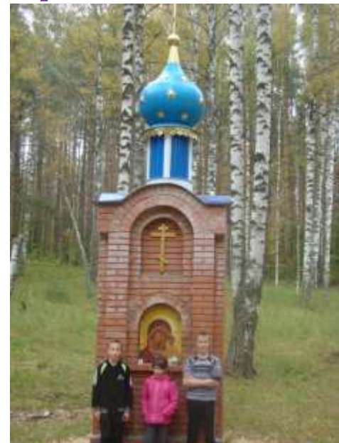
Источник Пресвятой Богородицы