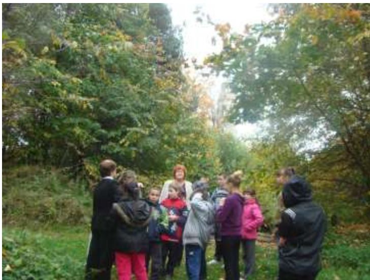
На городище древнего города