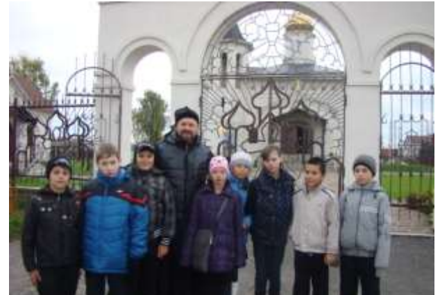
Храм Благовещения Пресвятой Богородицы