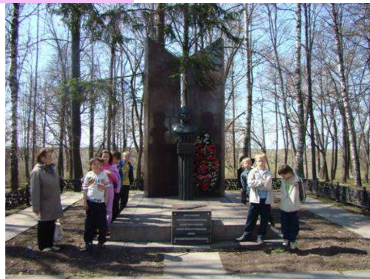
Мои́ла В.А.Дегтярева. Парк им. Пушкина

В 1978 г. в этом здании открыт мемориальный дом-музей В.А. Дегтярева. Конструкторская, трудовая деятельность В.А. Дегтярева, В.Г. Федорова и других создателей первоклассного оружия, которым оснащались наземные войска, авиация, флот, отражена в экспозиционном зале.